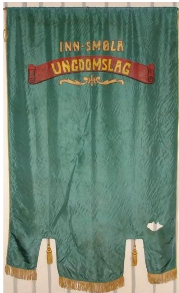
Bakside på gammel fane

Opptakten til fane ble tatt opp i styremøte 10. januar 1959. Da ble det vedtatt å få laget fane, og de gikk til innkjøp av tøy. Det var ønske om at den skulle være ferdig til 17. mai 1959.